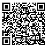
📖 大学院案内（本学 HP）