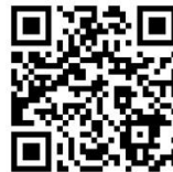
📄 大学院について (本学 HP)