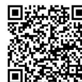
📄 シラバス検索 (外部サイト)

※検索項目の「課程」に「大学院看護学研究科博士後期課程」を入力して検索すると、「博士後期課程」の講義に絞り込むことができます。