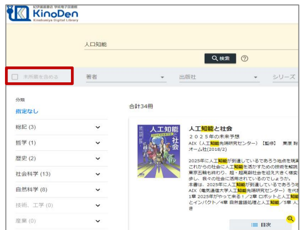
所蔵タイトルのみ

「未所蔵を含める」にチェックを入れると、本学にない電子書籍についても、内容紹介を確認し、試し読みをすることができます。