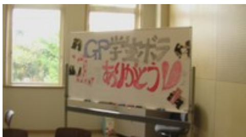
「集いの会」のボード

現代 GP 関連イベントや事業のボランティア活動は多岐にわたるため、それぞれのボランティア活動に参加している学生間の情報交換や交流の場として、平成 19 年 1 月及び平成 20 年 1 月に「集いの会」を教員が中心となって企画した。学生は、集いを通してボランティアに参加することで得られた学びを深めることができ、また参加したことのないボランティアの内容や活動の情報を得ることで、次年度のボランティア活動への参加の意欲が高まった。