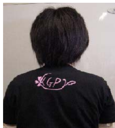
ボランティア T シャツ

現代 GP ホームページにも、写真などで定期的にボランティア参加の様態をアップし、参加学生の感想や印象も載せ、学内だけでなく、学外、地域の住民にも発信した。