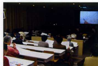
＜ボランティアの方にもご参加いただいた学生の実習経験発表の写真＞

しかし、今回が初めての实習であったために、教員にとっては指導上の多くの課題も見えてきました。これからも実習ボランティアの方たちに助けて頂きながら、よりよい学習機会を提供して行きたいと考えています。