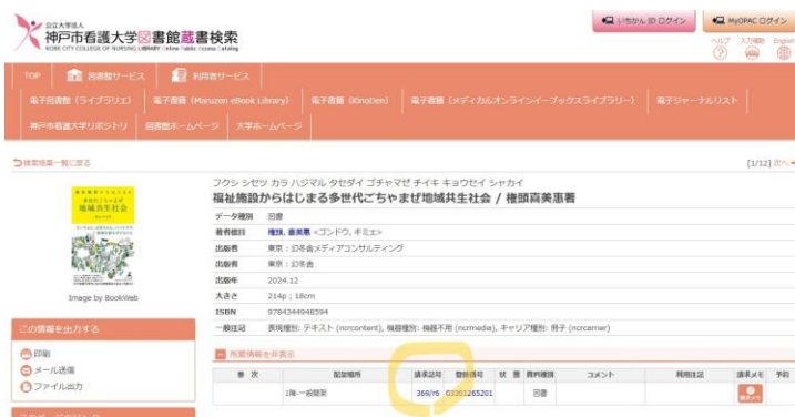
蔵書検索画面の例