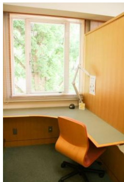
大きな窓のある1番ブース

図書館2階にあるキャレルコーナーは全6ブースあります。そのうち一つを「私の書斎」として2カ月間占有できることはご存じでしょうか。募集のたびに掲示板で目にされているかもしれませんね。