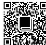
神戸市看護大学 図書館蔵書検索

図書館の資料は「請求記号」の順番で並べてあります。例えば下記画面の例にある「369」の場合、「書架の案内」写真のように、24の棚「369社会福祉」に並んでいます。この付近を探せば見つかるはずですが、あるはずの場所がないことがたまにはあります。そんなときはカウンターの図書館員にお声がけいただければ、一緒に検索いたします。