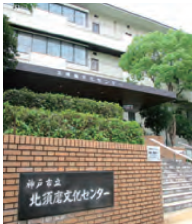
神戸市立北須磨文化センター

北須磨文化センターでは、神戸市看護大学生による健康相談会・認知症サポーター養成講座等で連携を進めるなど、今後とも地域住民の方々が健康に暮らせるような事業には積極的に協力し進めていきたいと思っています。