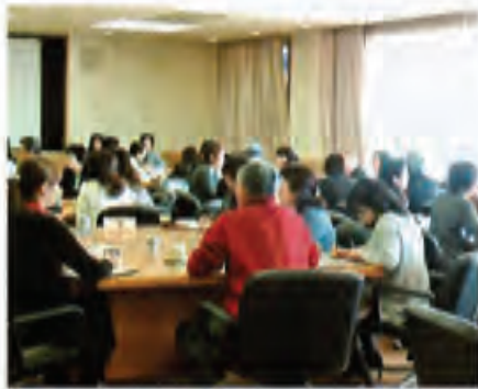
筆者が参加した 「教育ボランティア交流会」 教員と教育ボランティアさんとの グループワークの一幕

神戸市看護大学のCOC事業がより広く、多くの人々に伝わり、若い学生さん達や先生方と共に健康で幸せな地域となりますように、私も元気なうちに今自分に出来ることから少しずつでも参加させて頂き、励んでいきたいと思っております。