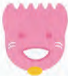
コスモちゃん 須磨区社会福祉協議会 イメージキャラクター

多くの人に関心を持っていただく工夫をし、知ってもらう工夫をしましょう。以上の提言をもとに、今後も地域の皆さんとともに考え、発信する場を作っていきたいと思っております。