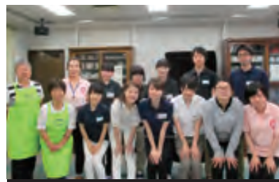
基礎看護技術演習 III 学外演習

私は今回の経験を通して、これからの地域づくりにはこのような世代を超えた交流の場と活動が増えることが必要だと改めて感じました。これまでのように、学生は学生とのみ、高齢者は高齢者だけというのではなく、世代を超えた関わり合いが増えることが地域を元気にしていくのだと思います。高齢者が多くなり子供が少なくなっている今の時代、世代を超えた、もっと気楽に参加できるコミュニティーの場が増えることで地域は活性化されると思います。