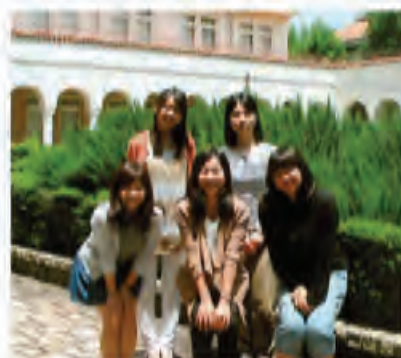
27年度入学の編入学生たちと (筆者は前列中央)

私は編入3年生なので、入学する前は看護師として地域医療に携わっていましたが、患者さんが今まで慣れ親しんだ環境の中で療養できると、やはり強い安心感があるのか、入院中は暗かった表情が、在宅に変わったとたん生き生きとしていく様子を目の当たりにしました。このように、地域・在宅での療養は患者さんにとってプラスなことが多い反面、家族の負担が増えることも多く、患者さんを含めた家族全体をどのように援助していくかが今後の課題であると思います。私は今までの経験の中で、地域・在宅医療に関わっていくためには、幅広い知識やコミュニケーション能力ももちろん大切ですが、この地域が好きで、そこに住む人たちのために頑張りたいと思える気持ちも大切ではないかと感じています。必修授業の関係で残念ながら私は受講ができませんでしたが、1年生の選択授業に「神戸学」という科目があり、地域の文化や歴史を学問として学べる環境があるということに、とても驚き興味を持ちました。これから神戸という地域をもっと知り、卒業後の看護に生かせるように頑張っていきたいと思います。