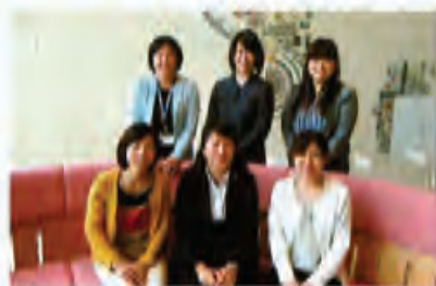
筆者(前列左端)と共同研究メンバー

今後は、これらの主訴に対して知っておいたらよいことや同じような悩みを持つ人の生活状況などを組み合わせる架空の事例（モデルケース）を作成し、ホームページなどでご紹介したいと考えています。相談活動とともに進めていく研究なので、どのような形になるのか予測しづらいますが、成果が楽しみです。研究メンバーと力を合わせて一步一步進めていきたいと思っています。