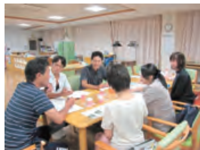
「須磨区多職種連携を考える会」

次号後編では、今年8月29日（土）に行われた第6回「多職種交流会」での方略の提案とその結果をご報告いたします。