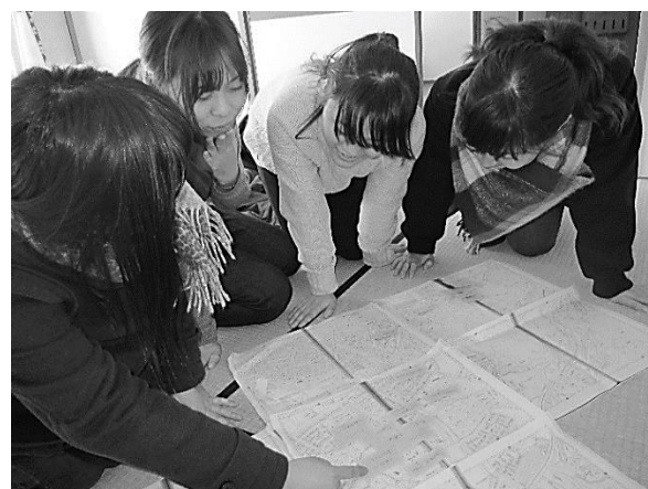
地図を見て地域の特性について情報整理