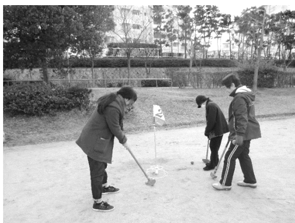
地域住民さんとグラウンドゴルフを体験